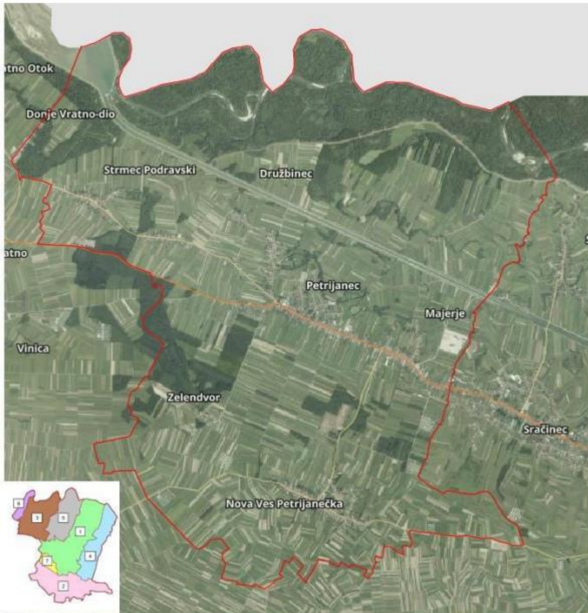
Slika 1.1: Položaj Općine Petrijanec

U Općini je registrirano 93 poslovnih subjekata, odnosno 46 tvrtki, 20 obrta te 27 udruga. Najviše poslovnih subjekata nalazi se u naselju Petrijanec, ukupno 47, odnosno 50,54% od ukupnog broja poslovnih subjekata.